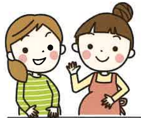
名古屋市の委託事業です